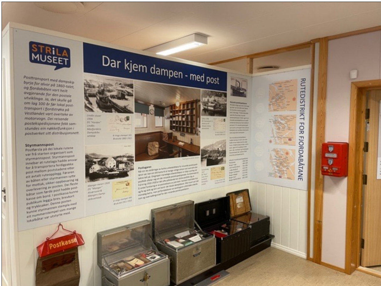
Reisande postekspedisjonar. Skriner inneheldt alt utstyr som postekspeditøren hadde bruk for i tenesta om bord i fjordabåten. Montert juni 2021.