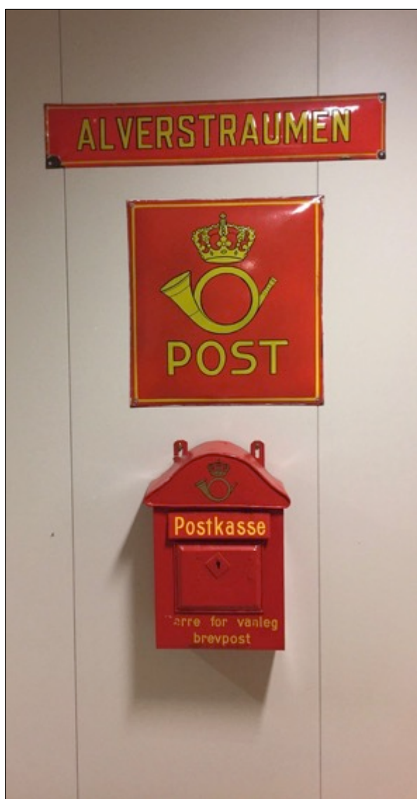
Ved inngangen til postopneri-utstillinga finn publikum postskilt og postkasse med logo frå 1935 samt originalt postskilt frå Alverstraumen postopneri.