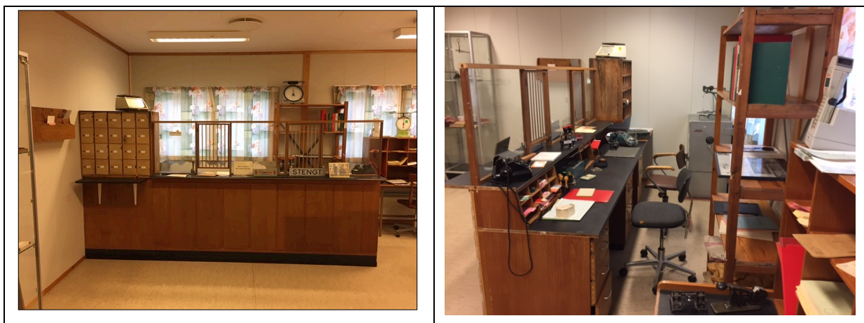
Postopneriet på Festo. Snart ferdig for opning.