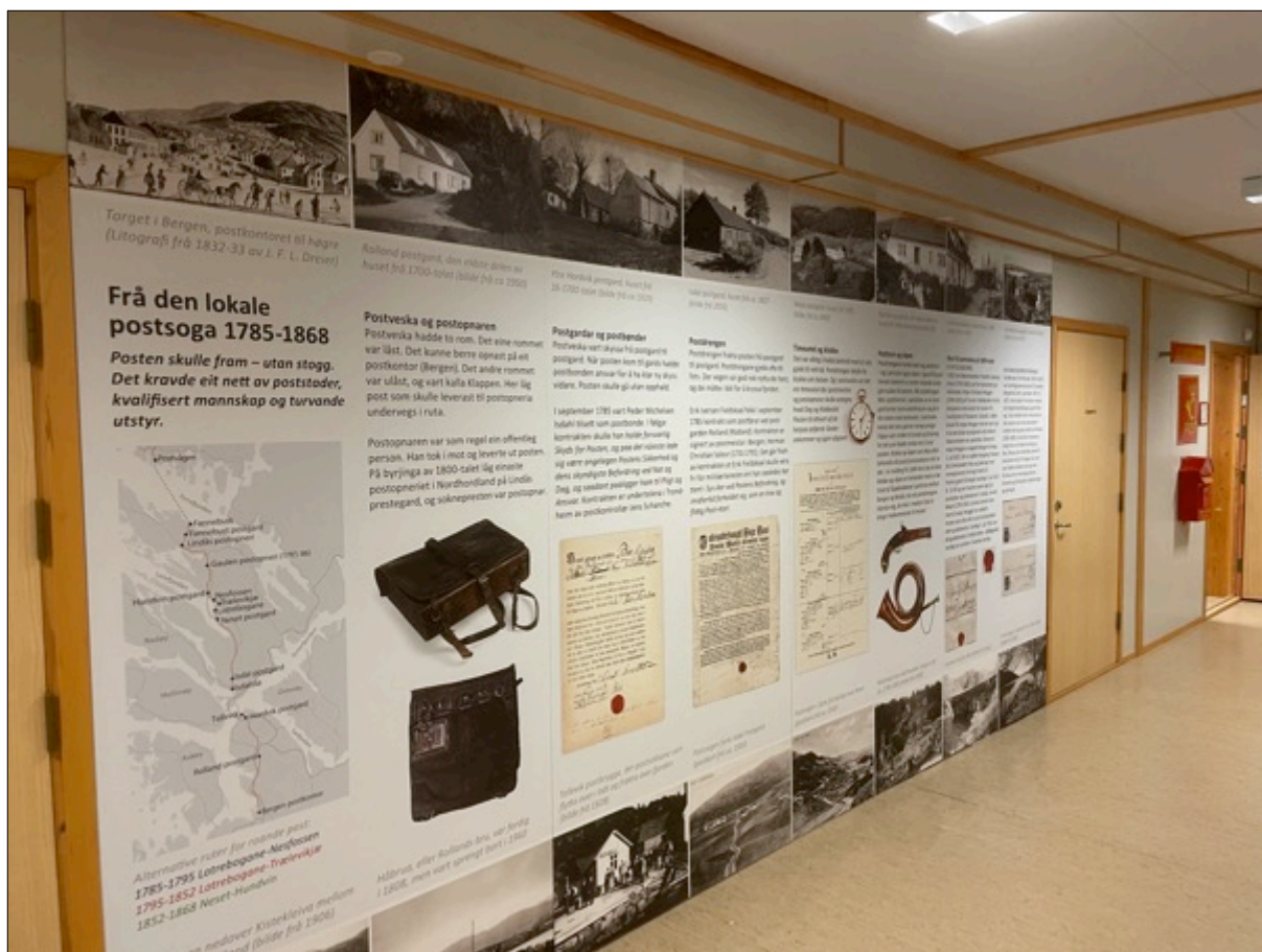
Vegg 2. Frå den lokale postsoga 1785-1868 . Presentasjon av postgardar, postopneri, knutepunkt, postalt utsyr og døme på brev. Montert juni 2021.