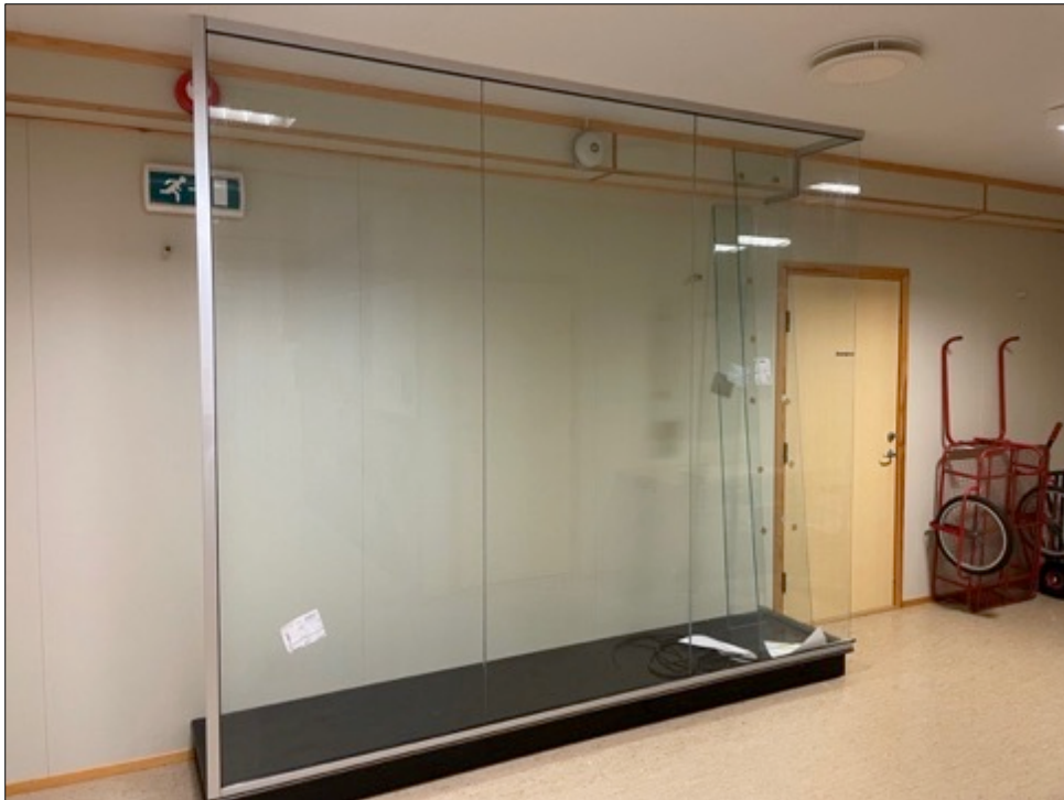
Glasskåp til uniformsutstillinga montert juli 2021